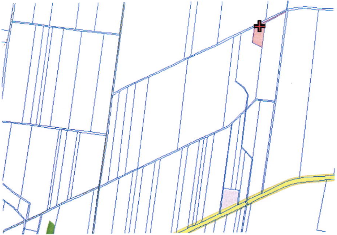
Obręb. Maków Dz. nr 432, k. m. 7