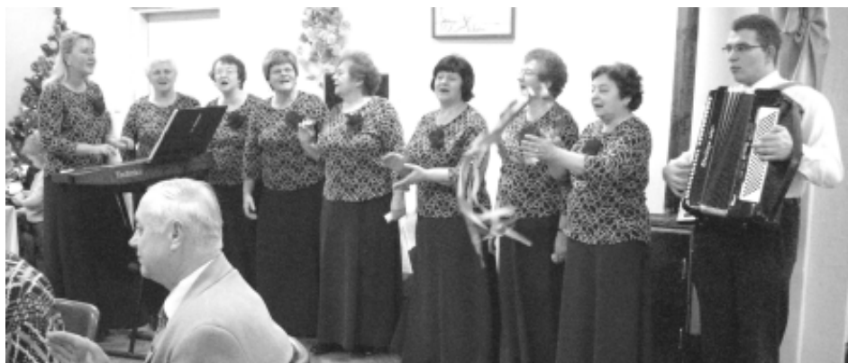
„Biesiada Olzańska” podbiła serca biesiadników