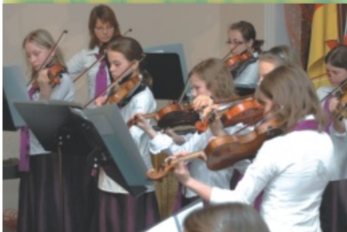
Występ Orkiestry Smyczkowej z PSM w Raciborzu