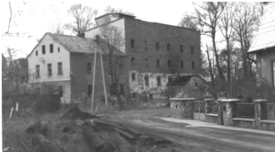
Młyn w 1981 r. krótko przed rozbiórką

Z chwilą wybudowania mostu przez Cynę/Psinę i poprowadzenia linii kolejowej przedłużenie dzisiejszej ul. Młyńskiej znikło. Znacznie większy ruch zrobił się przy dzisiejszej ul. 1 Maja. Pisaliśmy, że tamtejszą karczmę właściciel folwarku sprzedał w 1858 r. Zmniejszenie ruchu zapewne spowodowało, że karczma przy ul. Młyńskiej musiała zostać zamknięta. Stało się to zapewne ok. 1854 r., kiedy zamknięto księgę gruntową tej nieruchomości.