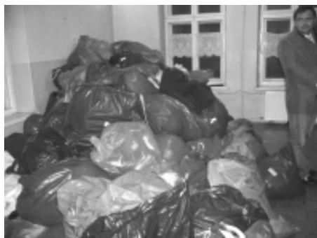
Zapakowane dary - w chwilę po wyładunku w Pietrowicach

W grudniu ubiegłego roku, przed świętami Bożego Narodzenia, po raz kolejny delegacja naszej gminy pojechała z wizytą do partnerskiej gminy Liederbach. Nasi delegaci na świątecznym kiermaszu zaprezentowali tradycyjne regionalne potrawy, wypieki i wyroby rękodzieła: stroiki i inne dekoracje bożonarodzeniowe. Wizyta była okazją do zacieśnienia więzi z sympatykami naszej gminy, których grono ciągle się powiększa i nawiązania kontaktów z nowymi mieszkańcami gminy Liederbach.