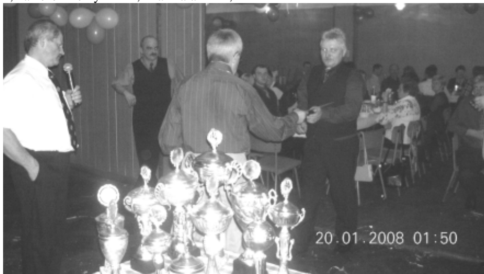
Czas rozdać puchary...