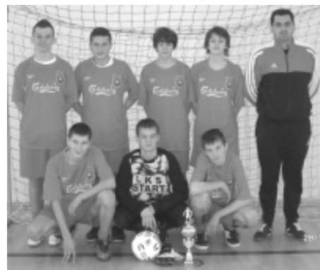
Zwycięska drużyna piątkowego turnieju LKS „START” Pietrowice II