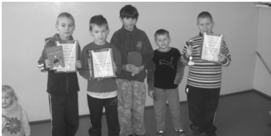
Laureaci turnieju z trofeami