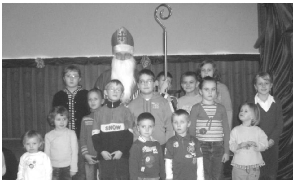
Święty Mikołaj wśród dzieci z Koła DFK Pietrowice Wielkie