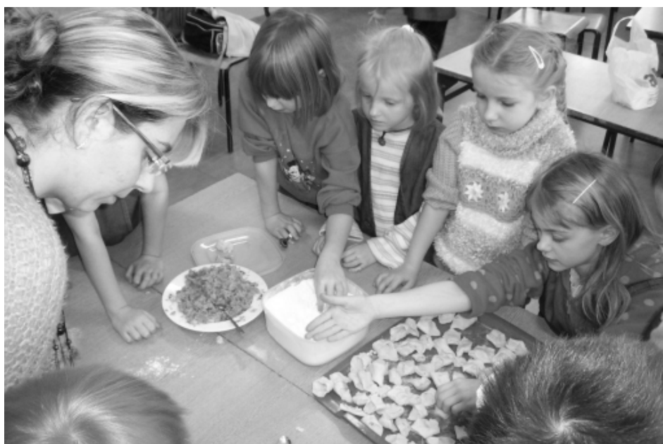
Dzieci z przejęciem wałkowały ciasto, faszzerowały i sklejały uszka