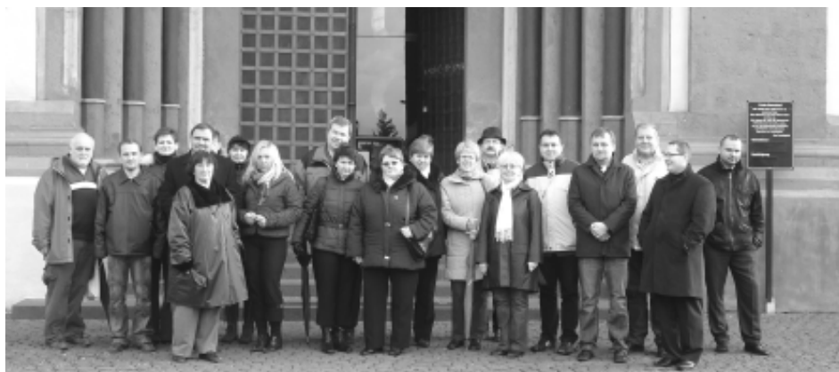
Przed wejściem do katedry w Limburgu

Wspólne spotkania sprzyjają integracji i scalają obydwie strony w jedną samorządową rodzinę.