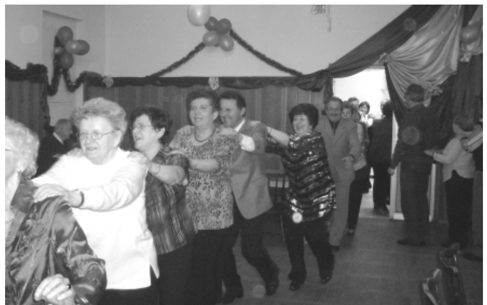
Uczestnicy zabawy utworzyli gigantycznego tańczącego „węża”