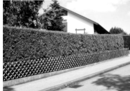
Równo przystrzyżony żywopłot jest prawdziwą ozdobą posesji

wanego czerwonego latem żywopłotu rozciąga się wzdłuż ulicy i budzi podziw. Tradycyjnie każdy mieszkaniec przed swoją posesją opiekuje się żywopłotem. Efekt tego wysiłku cieszy mieszkańców tej ulicy i przyjeżdżające osoby. Za tę inicjatywę serdecznie mieszkańcom dziękuję i tak trzymać dalej.