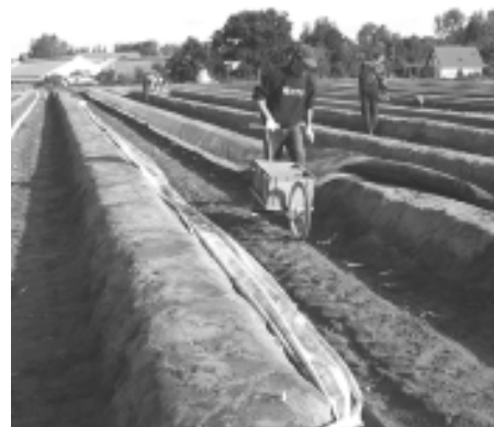
Często miejscem pracy Polaków za granicą są uprawy szparagów

- nie załatwaj tysięcy spraw równocześnie, ale przede wszystkim spędzaj czas z najbliższymi, pozwól im towarzyszyć ci w załatwianiu twoich spraw.