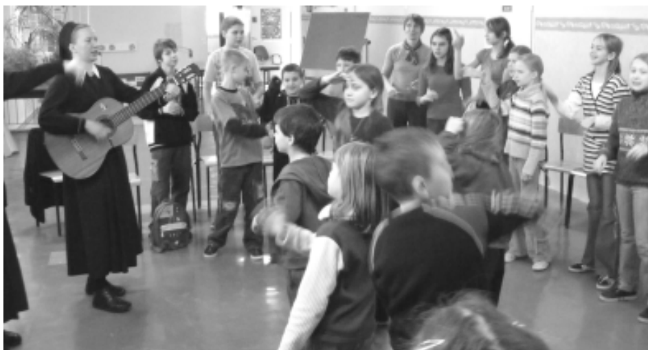
Siostry z Winowa zachęciły do śpiewu i zabawy

Na tegoroczne ferie Zespół Szkolno – Przedszkolny przygotował dla swoich uczniów dwa tygodnie ciekawych zajęć. Celem zimowiska było zapewnienie dzieciom jak największej ilości ruchu na świeżym powietrzu. Organizowano wycieczki, gry, zabawy, a także spotkania z ciekawymi ludźmi.