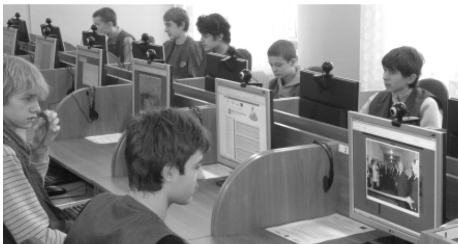
Każde stanowisko wyposażone jest w kamerę i słuchawkę z mikrofonem