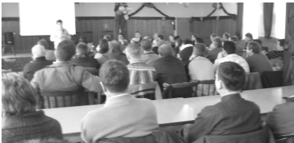
Szkolenie dla rolników w sali OSP w Pietrowicach Wielkich

Rozpoczynający się rok 2008 dla rolników niesie nowe wyzwania i konieczność sprostania wymogom stawianym im przez UE oraz instytucje działające na rzecz rolnictwa. Rosnące koszty produkcji rolnik może zrekomensować stosowanymi dopłatami do produkcji rolnej. Należy jednak spełnić szereg wyznaczonych dla rolnika warunków. Unijna zasada Cross – Compliance czyli „Spełnianie standardów w dziedzinie ochrony środowiska i konsumenta” obowiązywać będzie w Polsce od 01.01.2009. Od spełnienia powyższej zasady uzależnione będą unijne dopłaty bezpośrednie w pełnym wymiarze. Należy podkreślić, że nie są to wymagania nowe. Rolnicy korzystający do tej pory z pomocy unijnych w ramach programów PROW i SPO, aby otrzymać dopłaty z tych programów muszą już spełniać te wymogi. Nie dotyczyło to jednak jeszcze dopłat bezpośrednich. Od 2009 roku nowością będzie połączenie wypłacania również dopłat bezpośrednich z zastosowaniem tych przepisów przez rolników w swoich gospodarstwach.