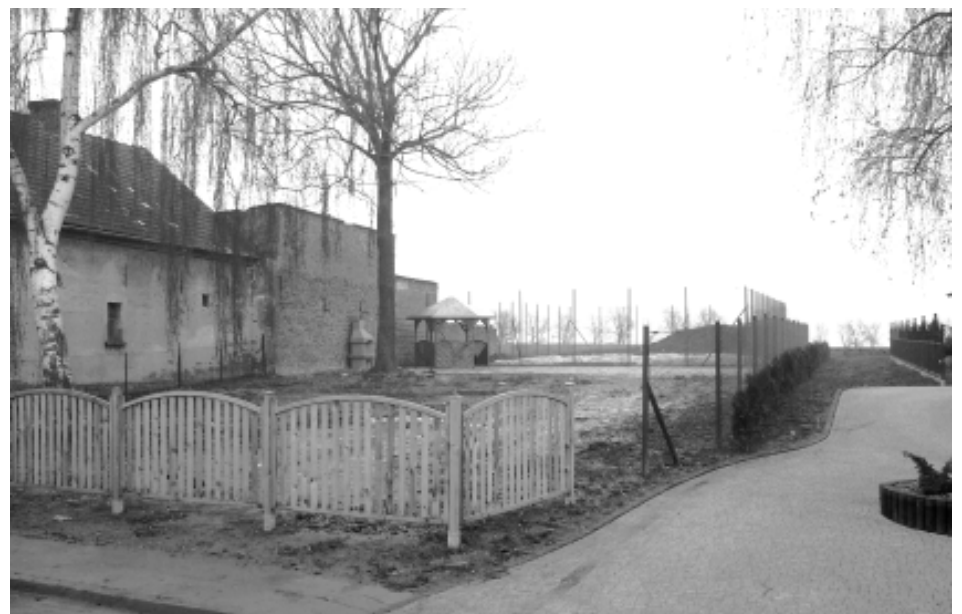
Żerdziny - „Zielone Centrum”

D.H. Również dziękuję i namawiam wszystkich do czynnego uczestniczenia w życiu swoich wiosek.