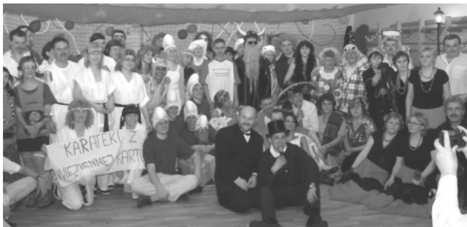
Bociek z żabką, policjantka i złodziej, kowboje i Indianie - wszyscy zgodnie się bawili i do zdjęcia ustawili

Karnawał tego roku był bardzo krótki, więc prawie wszystkie soboty pochłaniały zabawy karnawałowe. O tym, że najbardziej oczekiwaną imprezą w okolicy jest samborowski bal przebierańców świadczy fakt, że nie wszystkim, którzy chcieli w nim uczestniczyć, udało się zdobyć bilet. Co roku w godzinach popołudniowych mieszkańcy oraz goście bawią się w kolorowym korowodzie z udziałem małego i dużego misia, kominiarza, młodej pary, myśliwych. Największy popłoch sięją „małpy”, które smarują sadzami wszystkich napotkanych. Oczywiście wstydem jest być w tym dniu czystym. To przecież „ostatki”. Jak mówi tradycja: „kogo małpa