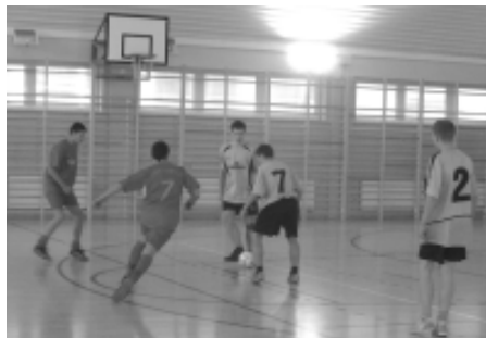
Podczas turnieju toczyła się ostra walka.

Piątkowy dzień całkowicie przeznaczony był dla Juniorów Młodszych. W turnieju brały udział 4 drużyny: LKS „START” Pietrowice I, LKS Samborowice, LKS Cyprzanów oraz poprzez nie stawienie się drużyny z Pawłowa (mimo zaproszenia) LKS „START” Pietrowice II. Po równie zaciętej i ostrej walce jak w dzień poprzedni ostatecznie zwycięsko wyszła drużyna Pietrowic II mając 9 zdobytych punktów oraz mając równie imponujący stosunek bramkowy co drużyna z Pawłowa dzień