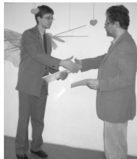
Leśnik z Rud Raciborskich dziękuje dyrektorowi za udział szkoły w konkursie