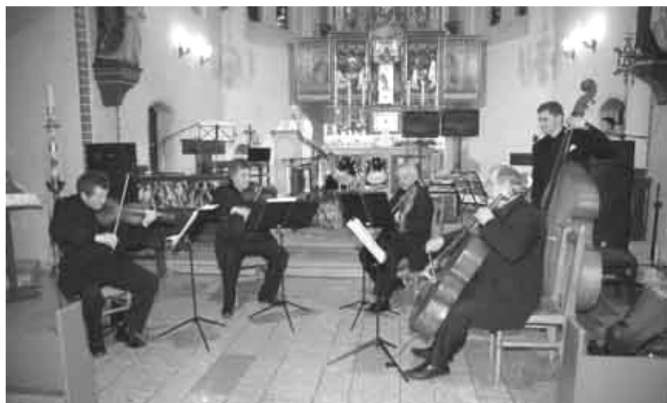
Występ Kwintetu Smyczkowego „Divertimento”