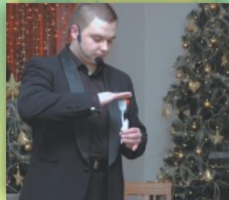
Iluzjonista przekonywał, że niemożliwe jest możliwe