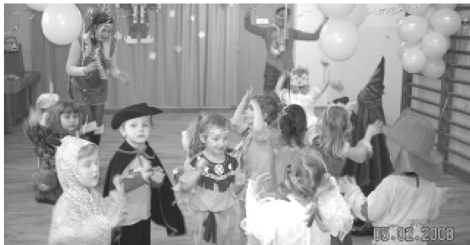
W ostatni dzień karnawału przedszkolacy z Pietrowic Wielkich bawili się na całego w pięknych przebraniach w przedszkolu. Wspólna zabawa dostarczyła wiele radości i zabawy dla wszystkich uczestników.