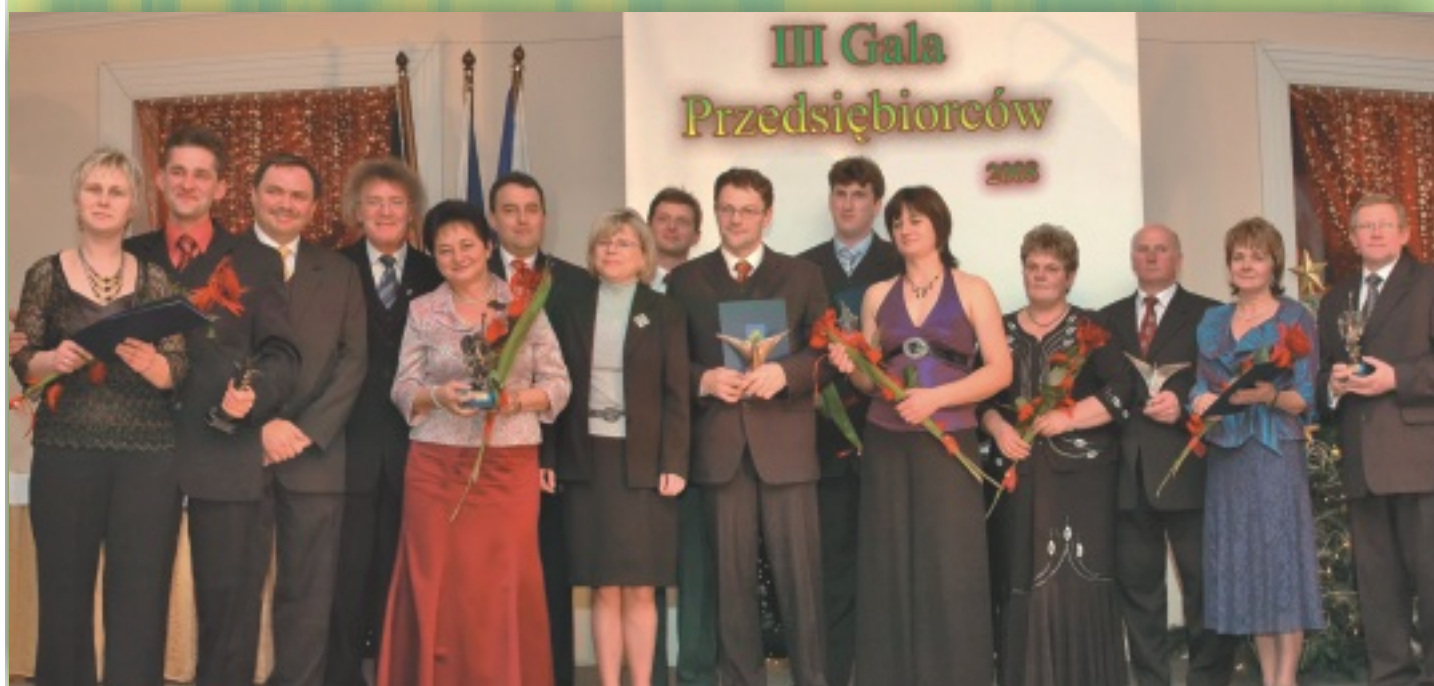
Pamiątkowe zdjęcie laureatów Gali