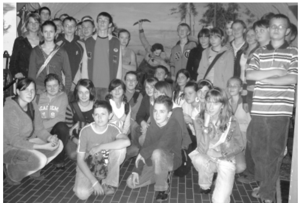
Uczniowie w muzeum figur woskowych