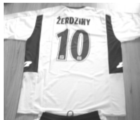
Nowe koszulki sportowców z Żerdzin