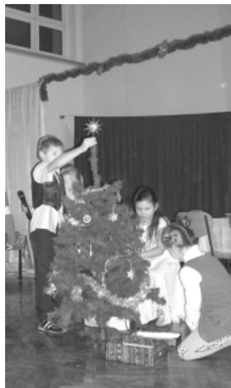
Inscenizowane przygotowania do Wigilii