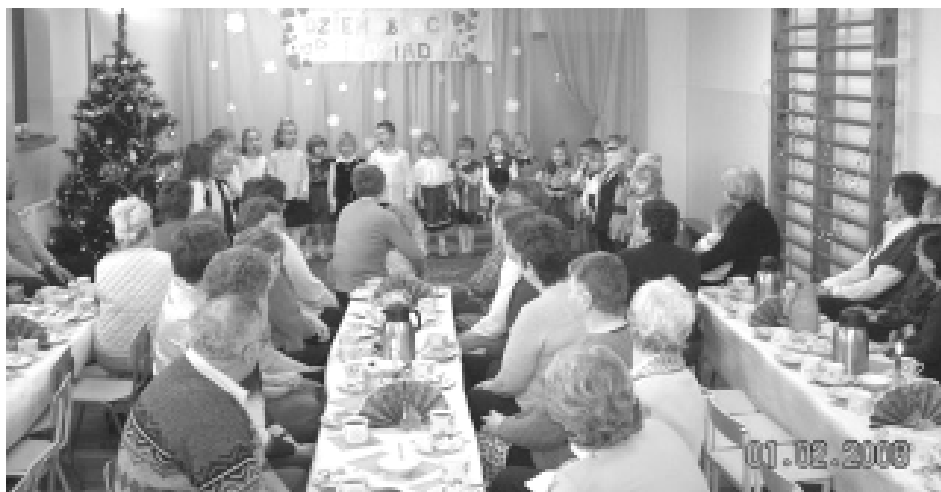
Występy wnuków zawsze cieszą serca babć i dziadków